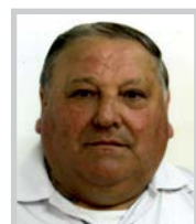
G. Lala PEL Villefranche du Périgord