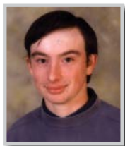
E. Bourbon PEL Meilhan