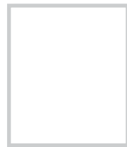
remplacement en cours PEL Lavardac