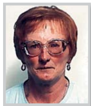
C. Jolis PEL Houeilles