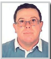
G. Sassy PEL Castelmoron