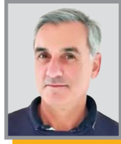
E. Jean-Jacques 1 er Vice-président Président EL Le Pays de Serres 2 e collègue