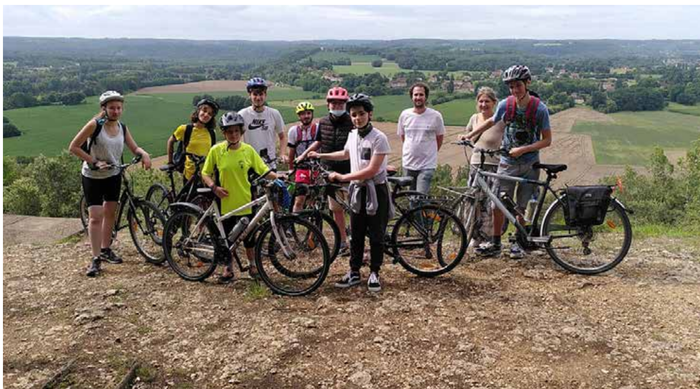
"Tour de Dordogne à vélo - projet porté par des jeunes en association"

Notre voyage se déroulera durant l'été 2021 vers le mois de juillet."