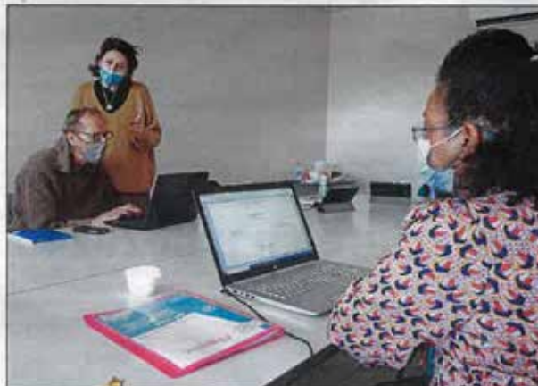
L'espace France Services de Belvès accueille depuis octobre une formation au numérique dispensée par la MSA

Il n'y a pas que les seniors qui peinent face à la place grandissante que prend le numérique dans nos vies. La fermeture de la trésorerie de Belvès, le 1 er janvier, a été une étape supplémentaire dans la marche vers la dématérialisation. L'espace France Services de la cité médiévale s'est rendu compte, ces derniers mois, que cette évolution mettait en difficulté une partie de son public. Elle a fait remonter cette information à la Mutualité sociale agricole (MSA), l'un de ses partenaires. Ensemble, les deux structures ont alors proposé une action de formation composée de douze demi-journées étalées d'octobre à fin janvier. Celle-ci est portée par la MSA, qui a dans son catalogue une formation labellisée intitulée Coup de pouce connexion :