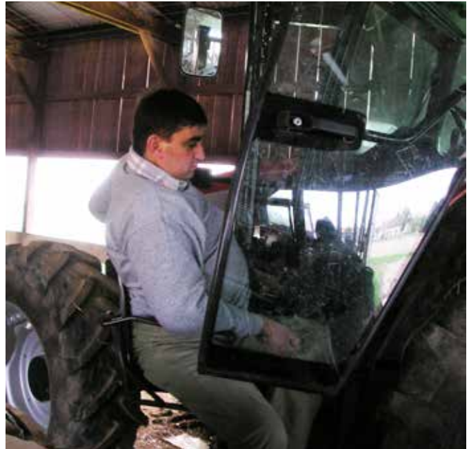
"Adaptation du poste de travail"

"La MSA DLG déploie des stages santé qui prennent la forme de journées d'information et d'échanges autour des conséquences des problèmes de santé sur le plan humain, familial, matériel et professionnel. Ces actions s'adressent à des personnes en arrêt de travail de plus de 90 jours et/ou en situation de fragilité de santé"