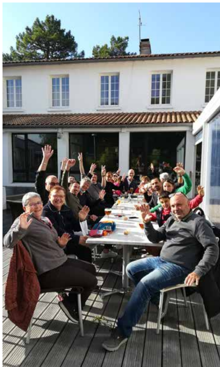
"Séjour répit Noirmoutier - 2021"