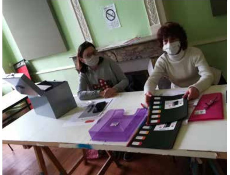
"Atelier mes petits papiers avec des salariés en insertion - 2021"