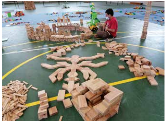
"Les familles bâtisseuses par la Brigade d'Animation Ludique Reaap - 2021"